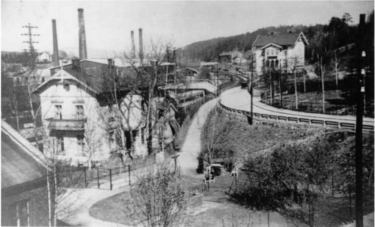
Jernbaneveien med Ellevolds kafe i bakgrunnen. 1930-årene.