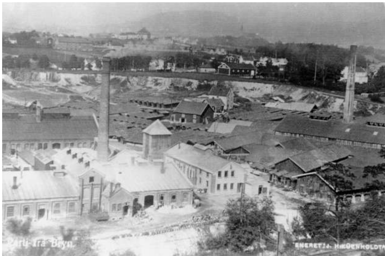
Industrivirksomhet på Bryn: Sinkhvittfabrikken og Bryn Teglværk. Ulven kirke i bakgrunnen

Produksjonen av tegl foregikk på en måte i to perioder. Om sommeren ble leira tatt ut, formet og tørket, og om vinteren brent. Etter jobbetiden under og like etter første verdenskrig ble det nedgangstider og vanskelig å skaffe arbeid. Mange kom skjevt ut under nedgangsperioden, de såkalte lasaroner eller lassiser. Disse livnærte seg kanskje med litt smånasking og tigging. De var husløse, og for å livberge seg gjennom vinteren var det mange av dem som lå på teglverkene hvor de store ovnene varmet godt. Mange av dem kom til Murgården for å tigge 10 øre til en kopp kaffe, men også om en skive brød. Hvis det var noen øre de fikk, gikk nok disse myntene til et eller annet å ruse seg på. Dette kunne være alt mulig fra billig brennevin, øl, rødsprit eller tørrsprit. Rødspriten kunne jo drikkes, mens tørrspriten ble smurt på en brødskive. Politur, basert på sprit og skjellakk ble også konsumert. For å gjøre skjellakken drikkelig, ble spriten skilt ut ved å ha tørt brød på flaska og riste den. Skjellakken og brødet løp da sammen, slik at spriten kunne siles fra. Dette kaltes å riste "skåp". Hard kost, men de fleste av disse typene var godt herdet.