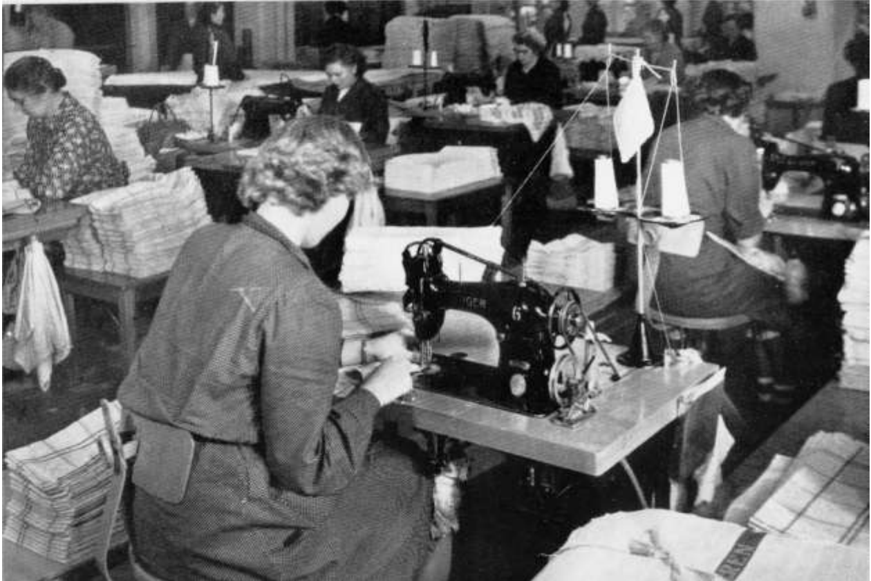
Syersker på Joh.Petersens Petersens Lin og Bomullsveveri