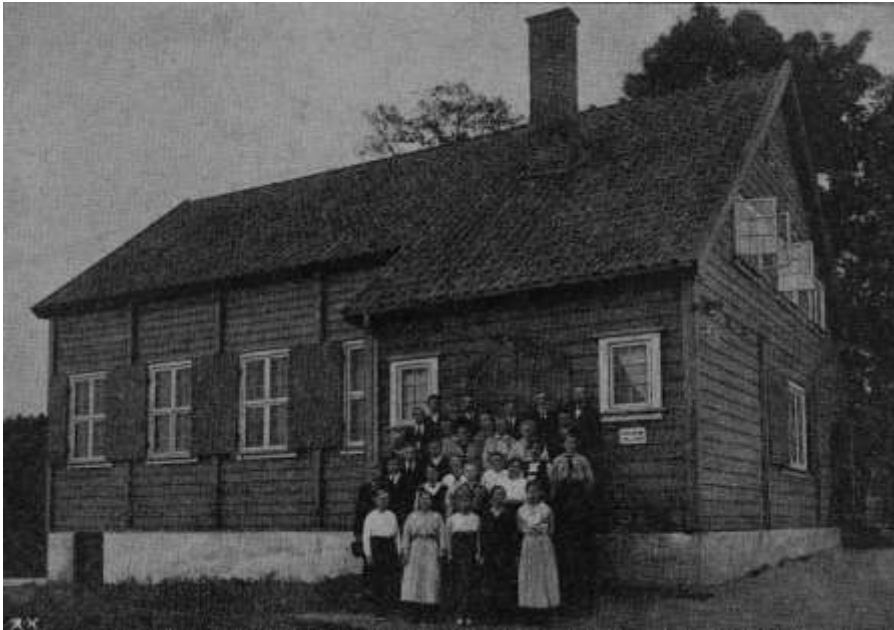
Avholdsbevegelsens Klosterheim –fullført i 1911 – ble også brukt til amatørrevyer

Av andre kulturaktiviteter kan nevnes basarer, enten på Ø. skole, Breidablikk eller Klosterheim. På Klosterheim var det ofte amatørrevyer som ble arrangert av et eller annet kor eller idrettslag. Særlig aktive var Bryn mannskor, sangkoret Fjelljom, (senere Bryn korforening,) samt idrettslaget Bjart. Når det var basar eller revy på Klosterheim, så var det som regel i tillegg salg av ”årer”, skytebane med luftgevær, og dans. Det var som regel en med trekkspill som sørget for dansemusikken.