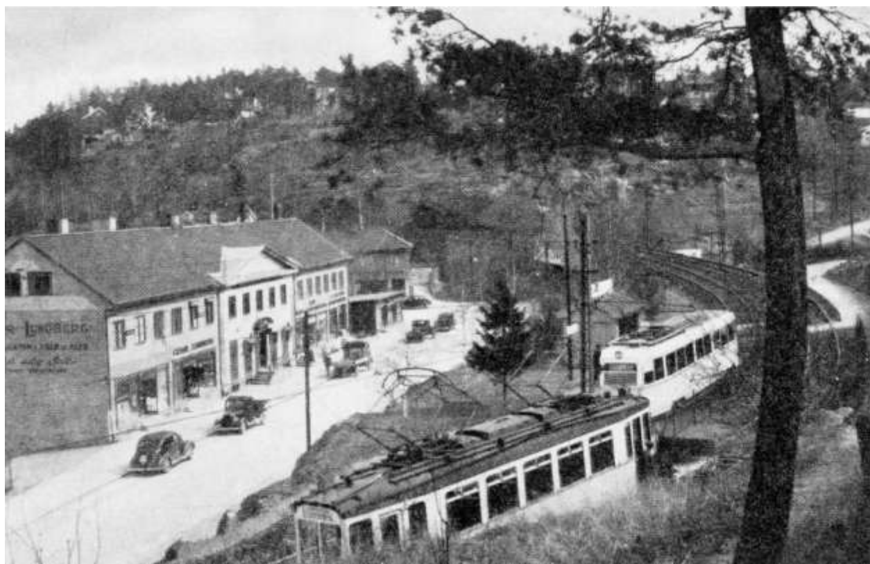
Fra venstre: Thorsens kolonial, Cæsar Lundbergs elektriske foretning, Bryn apotek, Bryn manufaktur, SE Gullerud Isenkram og Fargehandel. Til høyre: Margit Sembs bokhandel. Trikken: A-vogn og en Gullfisk krysser hverandre. Fra slutten av 1930-årene