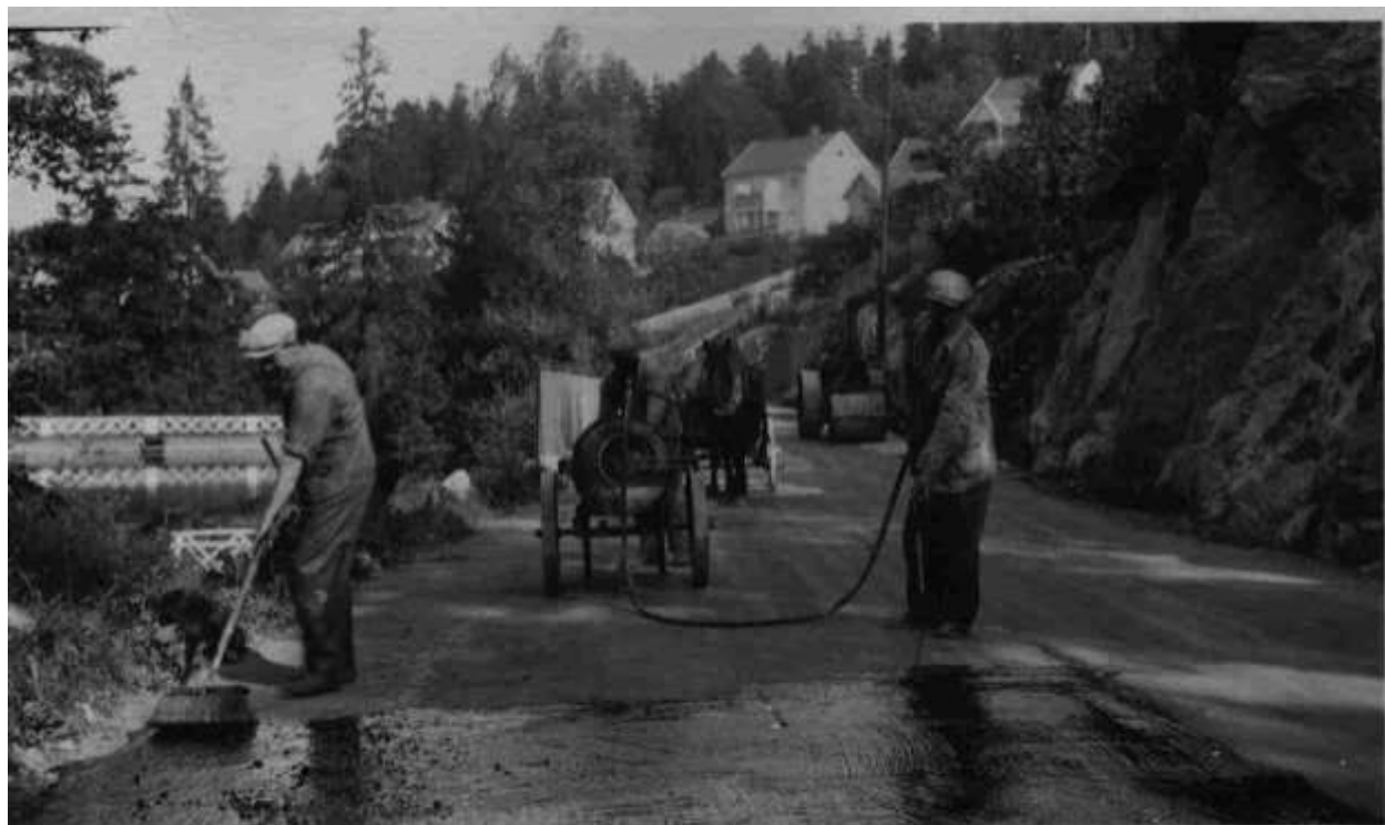
Østensjøveien får fast dekke i 1932 (Oljegrus)

Det var lite biltrafikk den gang, vesentlig vare- og lastebiler. Vi kunne derfor trygt benytte Østensjøveien til aking på vinterstid. Det ble benyttet kjelker og sparkstøttinger, samt hjemmesnekrete skøytetraller. Vi gikk også på skøyter i veien, og da var det sport å henge bakpå sledene et stykke, særlig når bøndene på Oppsal og Østensjø kom med sledene fylt opp med overmodne bananer til dyrefôr. Det hendte vi fant en som kunne spises.