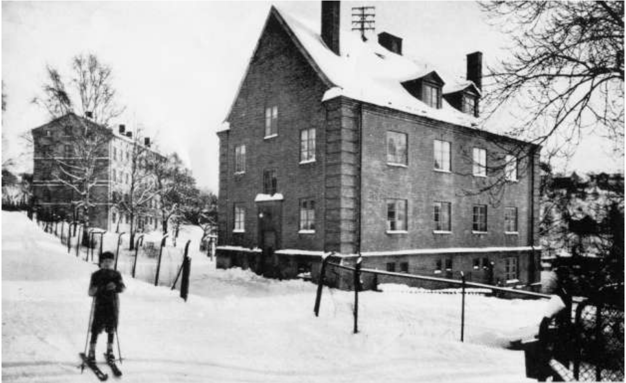
Havehuset i 1930-årene. Murgården i balgrunnen