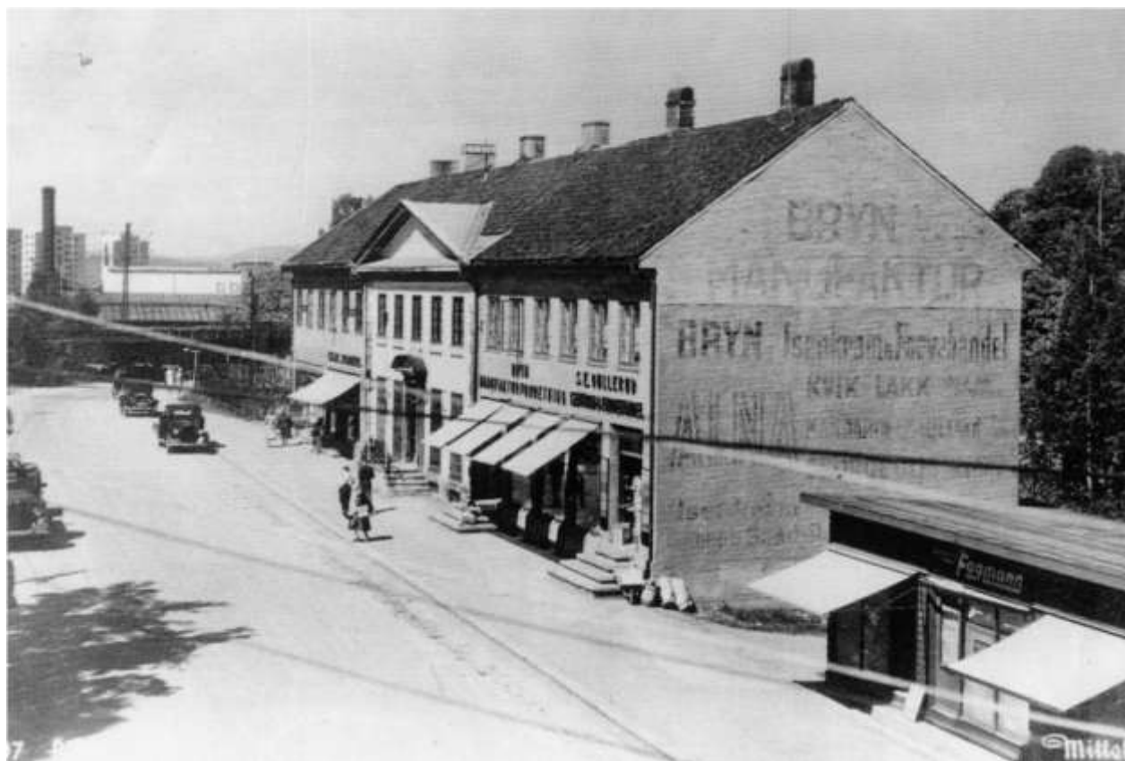
Bryn torg i slutten av 1930-årene. Brakken til høyre ble brukt av ulike forretninger bl.a. bokhandel og elektriker.

Mye arbeid ble utført ved hjelp av hester, både til vanlig transport samt anleggs og veiarbeid. Ved snefall var det ut med plogen som ble trukket av hester. Det kunne være opptil 6 hester i spannet, men uansett var det et blodig slit for både hest og mannskap. Det var mange kjørekarer som ikke var snille mot hestene sine. Ofte når lassene var i tyngste laget i de relativt bratte veiene i brynområdet, var det mange kjørekarer som slo hestene med svepe. På Bryn Torv, der hvor rundkjøringen er nå, var det en vannpost hvor både mennesker og dyr kunne slukke tørsten. Hestetroa var en stor uthulet granittblokk som dessverre er blitt borte. Den ville ha gjort seg i midten av rundkjøringen i dag. Fra torvet gikk det privatdrevet buss til Økern og Aker sykehus.