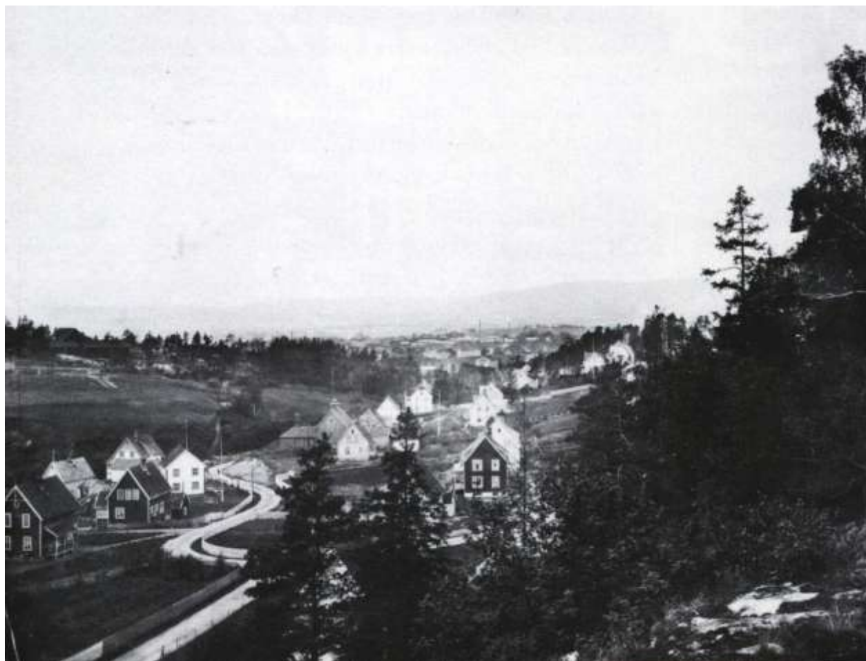
Fuglelieveien/Ringveien (nåværende Johan Evjes v) i 1923. Reiby-huset skimtes bak trærne i forgrunnen. I bakgrunnen sees det nybygde bedehuset.

med mat kom på tyve eller femogtyve kroner. Ukentlig sparing hadde pågått i lange tider. En slik tur var den gang en stor opplevelse.