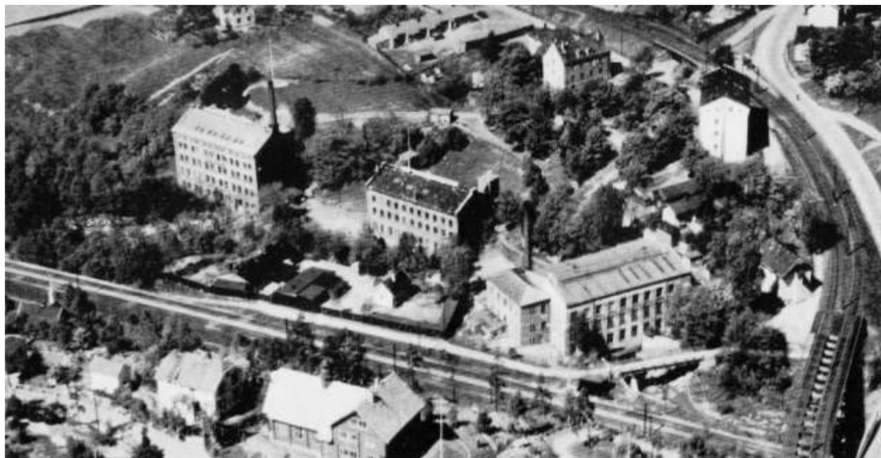
Joh.Petersens Petersens Lin og Bomullsveveri 1931. I øverste billedkant skimtes fra venstre Flaen, hønsegården, Havehuset, Murgården og Føyengården. I forgrunnen speiderhuset Breidablikk og foran veveriet sees fabrikken til Gohn.

Det larmet veldig inne på fabrikken. Maskinene duret og gikk, og hver gang skyttelen ble slått frem og tilbake smalt det kraftig, og dette gikk i et meget høyt tempo. Mønsteret som skulle være i duker og andre stoffer, ble styrt av hullkort. Det var små papplater med diverse hull i midten som var lenket sammen, og satt i toppen på vevstolene. Driften av vevstolene kom fra lange akslinger med remskiver som gikk i taket, og fra disse remskivene gikk det drivremmer ned til tilsvarende remskiver ved hver vevstol.